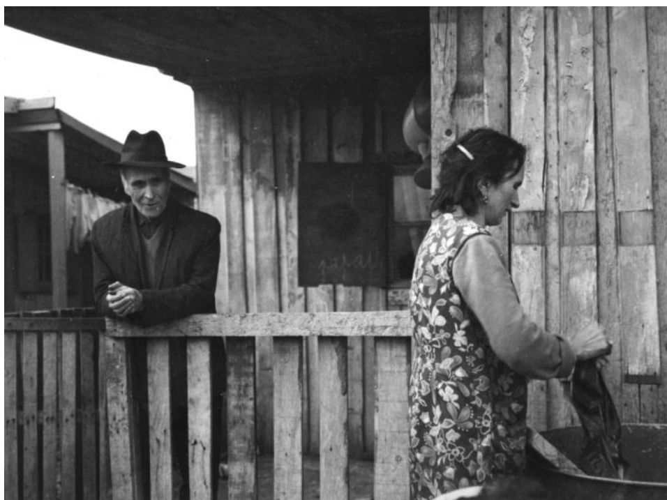
Rio de Janeiro – RJ, 2016