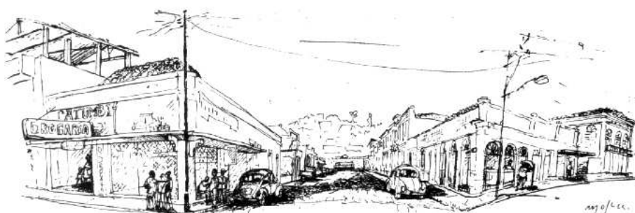
Esquina das Ruas Pedro Mascarenhas e Catumbi