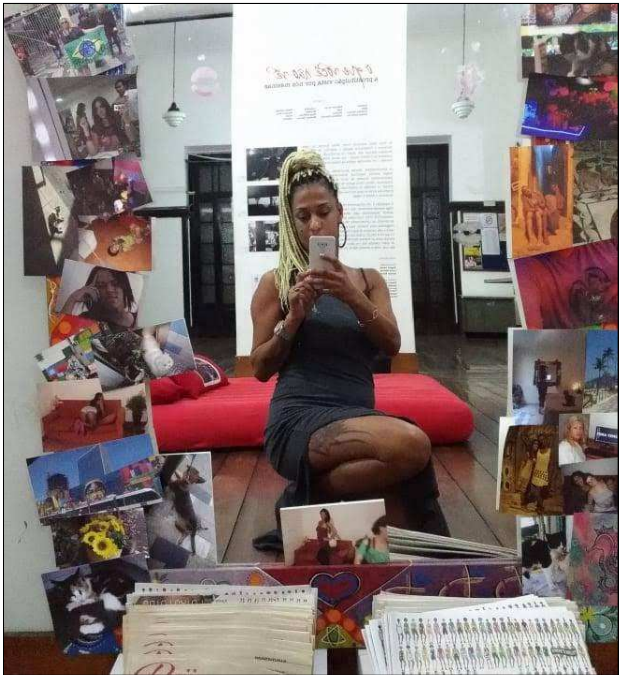
Rio de Janeiro – RJ, 2018