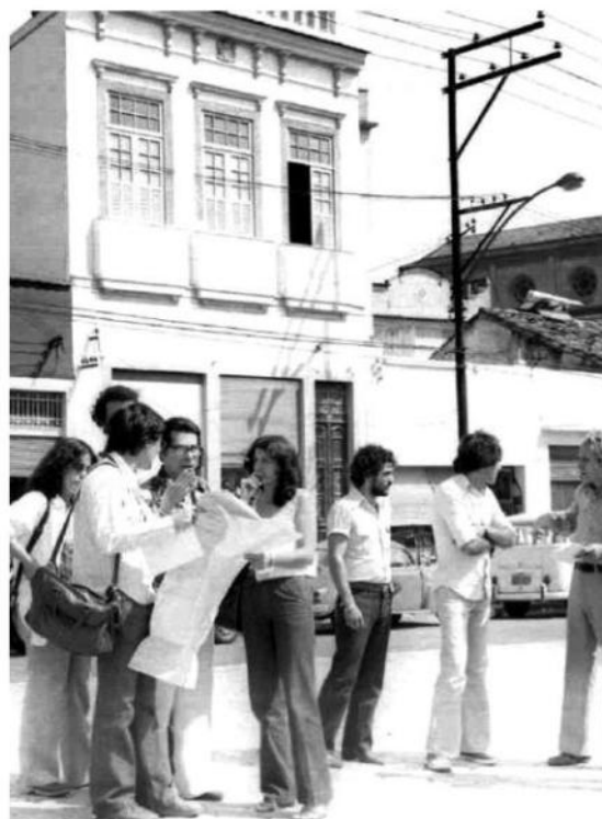
Urbanistas trabalhando nas demolições do bairro do Catumbi, na década de 1970.