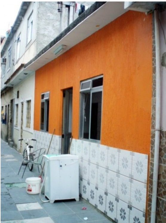
exemplo de fachada de uma das casas do Monte Castelo (à direita)