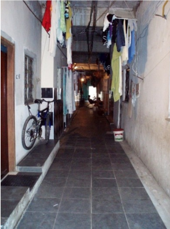
Corredor que foi revestido pelos moradores Foto Maíra Machado-Martins, 2009

negociação sobre a decisão, rateio e colocação do revestimento no piso dos corredores. A ação empreendida demonstra o cuidado e a valorização de um espaço que é compreendido com uma extensão de cada uma das unidades que constituem um mesmo corredor da ocupação, contribuindo igualmente para a manutenção de uma rede de vizinhança que caracteriza a sociabilidade neste momento de consolidação do Monte Castelo. Nesta etapa, as dificuldades resultantes da ocupação do espaço e de suas primeiras adaptações já havia sido vencida. Os moradores relatavam com orgulho a resistência que os fez permanecer e construir cada casa juntos no momento inicial do empreendimento coletivo e lembravam das dificuldades em momentos de enchentes e de insalubridade vividas tão logo haviam ocupado a antiga usina. A segunda etapa, se caracteriza pelo sentimento de vitória e pela memória coletiva construída ao longo do processo que resultou na consolidação das moradias e dos espaços de lazer (piscina, campo de futebol e praça). A valorização e cuidado com o espaço imediatamente exterior às unidades é igualmente percebido no Monte Castelo, através da observação das diferentes fachadas das unidades de moradia, que indicam a maneira como cada um dos habitantes manifesta sua individualidade no interior da ocupação.