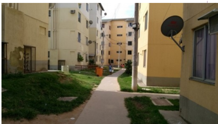
Conformação diferenciada observada em ambos os condomínios do Conjunto Ismael Silva – Zé Ketí Foto Carolina Trotta, 2017

Maíra Machado-Martins e Carolina de Carvalho Gambôa Trotta