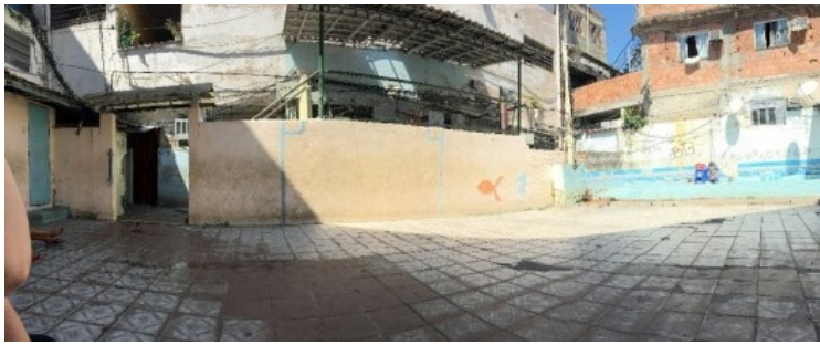
A praça, palco e piscina do condomínio popular Monte Castelo Foto Mateus Rodrigues, 2018