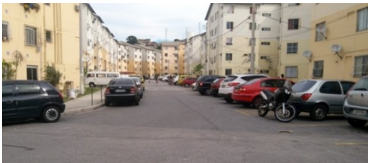
Rua-estacionamento no Condomínio Ismael Silva

Apesar da implantação descrita acima, em ambos os condomínios existem variações de ângulos e de espaçamento entre os blocos de apartamentos nestas áreas que, apesar de muito sutis em planta, geram espaços diferenciados entre eles. Um aspecto marcante deste empreendimento reside no fato de que, em cada um destes condomínios, parte dos blocos não têm seu acesso pela rua-estacionamento, e sim por caminhos de pedestres, cuja implantação forma diferentes ângulos e espaços entre eles. Os espaços conformados nestas áreas têm um acesso relativamente mais restrito, se comparado às áreas cujo acesso se dá pela rua estacionamento. Possuem também um caráter mais intimista, uma vez que se “escondem” entre os edifícios. Se conformam então como espaços coletivos de aspecto intermediário, tornando-se mais íntimas que os locais acessíveis pela rua-estacionamento.