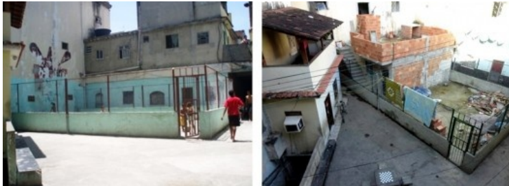
O campo de futebol em duas fases de desenvolvimento, identificadas no Monte Castelo