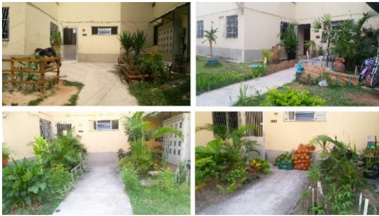
Exemplos de jardins no Conjunto Ismael Silva – Zé Ketí

Estas áreas de acesso aos blocos podem ser compreendidas como resultado da construção do espaço habitado e que apresentam grande valor para os moradores. Eles são lidos pelos habitantes como uma espécie de extensão do hall de entrada que é o espaço coletivo do bloco. É nestas áreas que os moradores de um determinado edifício podem materializar a forma como querem se mostrar tanto para seus vizinhos quanto para si. O diagrama abaixo identifica uma gradação dos espaços no Conjunto: dos mais privados [1] aos de caráter mais público [4].