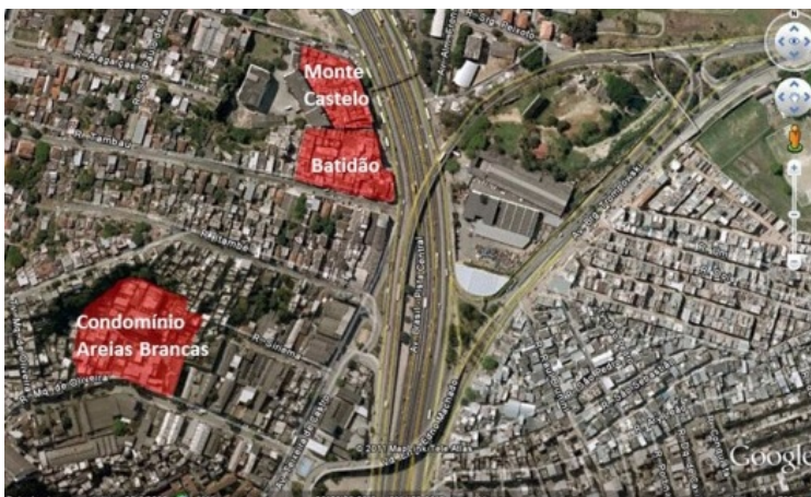
Localização das três ocupações

O segundo caso de análise caracteriza-se por uma forma de moradia popular definida pela ocupação, por uma população de baixa renda, de imóveis de função industrial abandonados e sua reconversão em moradia pelos próprios habitantes. Tais ocupações se iniciaram no fim dos anos 1990 e início dos anos 2000 e situam-se no bairro de Ramos, sob lotes lindeiros ou próximos à avenida Brasil, localizadas entre a referida avenida e a via férrea onde a companhia de trens urbanos Supervia opera o ramal Saracuruna. Três ocupações vêm sendo pesquisadas: "Condomínio Areias Brancas", "Batidão" e "Monte Castelo".